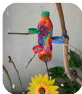
LA PRESENTACIÓ, DE REUS (TARRAGONA)